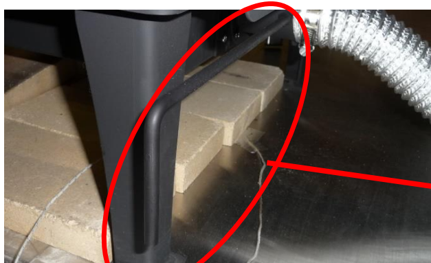
給気量調整ダンパー